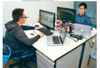
■PLAYNOTE聘請年青人加入研發程式的工作，他們不但擁有電子工程知識，更有樂理八級水平。

智能音樂教育是一個十分偏鋒的市場，Eric卻自信滿滿地表示：「視乎你怎樣看。偏鋒的市場，競爭自然少，亦有足夠的時間和空間給公司成長。」下一步，Eric計劃將程式發展到不同樂器的學習中，涵蓋更多類型的音樂考試，讓更多學生受惠。