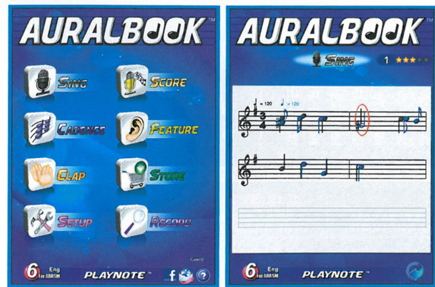
▲Playnote Auralbook利用人工智能技術，用戶儼如面對音樂老師。

他指出，適用於英國、澳洲和加拿大考試的AURALBOOK試用版(每一級包括10條題目)，可在Apple App Store或Google Play免費下載，目前全球約有10萬人已下載了該程式。「收費版本則提供電子書，每一級包括60條題目，Grade One售價98港元，Grade Eight則賣128港元，每一級都有數本電子書，百多二百條題