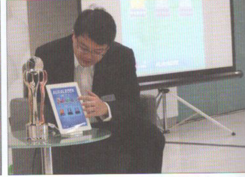
③ 同學只要一部平板機，即可隨時隨地進行音樂考試練習。