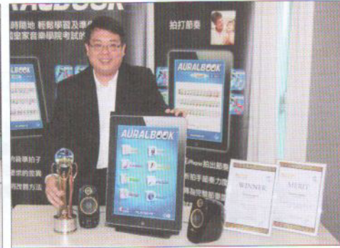
② 《AURALBOOK》提供嶄新遙距學習模式，曾於多個電子學習及創新科技比賽中奪獎。