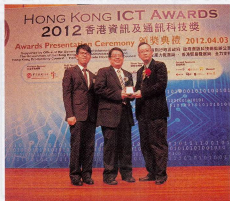
● Auralbook於「2012香港資訊及通訊科技獎」榮獲「最佳生活時尚獎（學習・生活）」金獎。