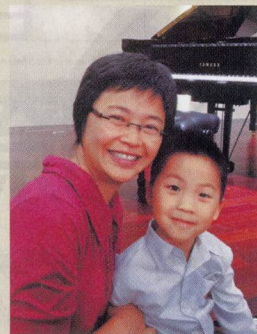
Dorothy 及其兒子 啓恩小學 2年級 ABRSM 英國皇家音樂學院考試 鋼琴 3級

「起初Playnote 在科大MBA校友通訊做宣傳，剛好我的小朋友要考鋼琴試，所以就嘗試使用。系統細說了考生的問題，最好的一點是它會說出鼓勵說話和要改善的地方。整個系統不是太難上手，但有時系統對學生的要求比人還要高。」