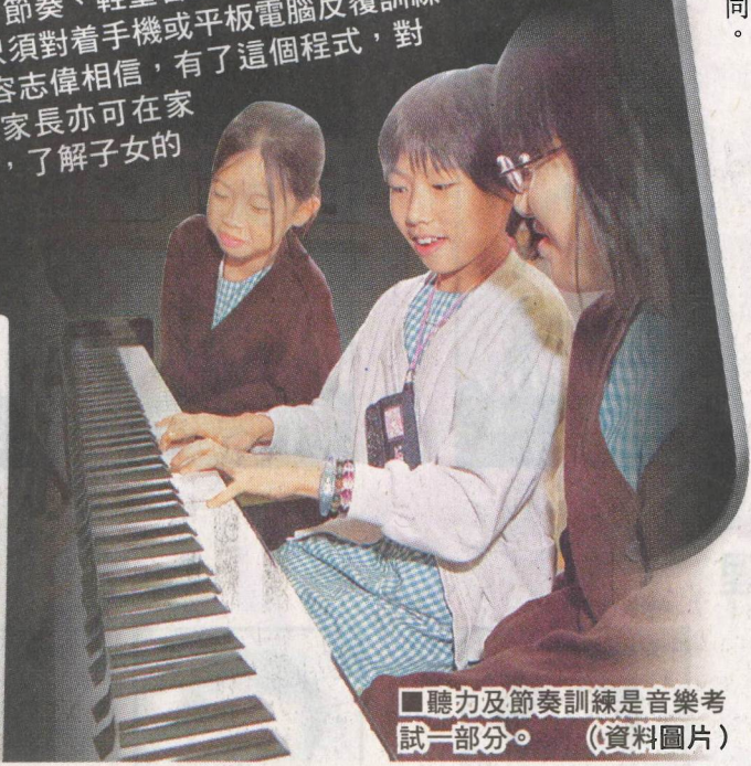
聽力及節奏訓練是音樂考試一部分。(資料圖片)